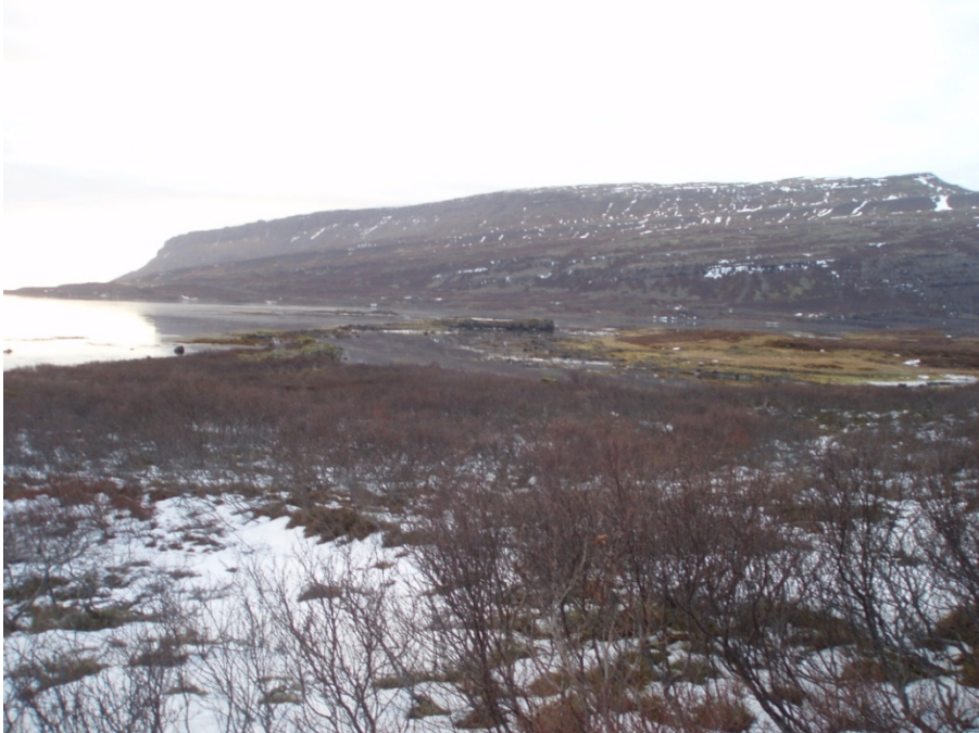
Mynd 5. Rannsóknarsvæði 3, horft yfir að Eiðshúsum, til hægri.

Í miðju rannsóknarsvæði 3 er mýrarblettur sem skiptir svæðinu í tvo hluta. Birkið á þessu svæði er hærra en á fyrri tveimur svæðunum eða frá 90 - 230 cm að hæð. Lífmassi á svæðinu reiknast frá 5.870 - 18.117 kg/ha. Meðaltal 7 mælinga er 8.644 kg/ha. Birkivaxið svæði sem mun skerðast er 0,7 ha og skerðing lífmassa birkis því 6.051 kg þurrefnis.