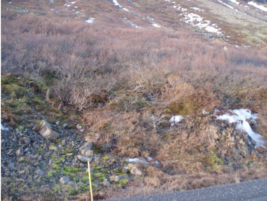
Mynd 7. Séð upp í hlíðina ofan vegar á rannsóknarsvæði 5.