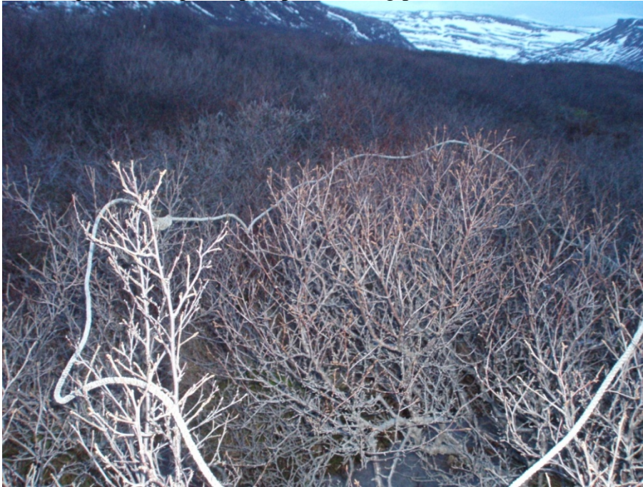
Mynd 9. Rannsóknarreitur á svæði 7.

Rannsóknarsvæði 7 er slitið í sundur af gamalli námu. Birkið innan við námuna er mjög lágvaxið og gisið en utanvert við námuna er herra birki. Hæð birkikjarsins er frá 65 - 140 cm. Reiknaður lífmassi er frá 3.372 - 18.681 kg/ha. Meðaltal 6 mælinga er 12.238 kg/ha. Svæðið sem áætlað er að muni raskast er um 0,8 ha að stærð og lífmassi birkiskógarins sem gæti tapast því 9.790 kg þurrefnis.