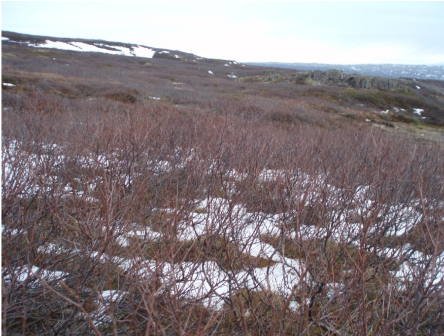
Mynd 4. Séð eftir veglínunni á rannsóknarsvæði 2, rétt við stöð 1200.