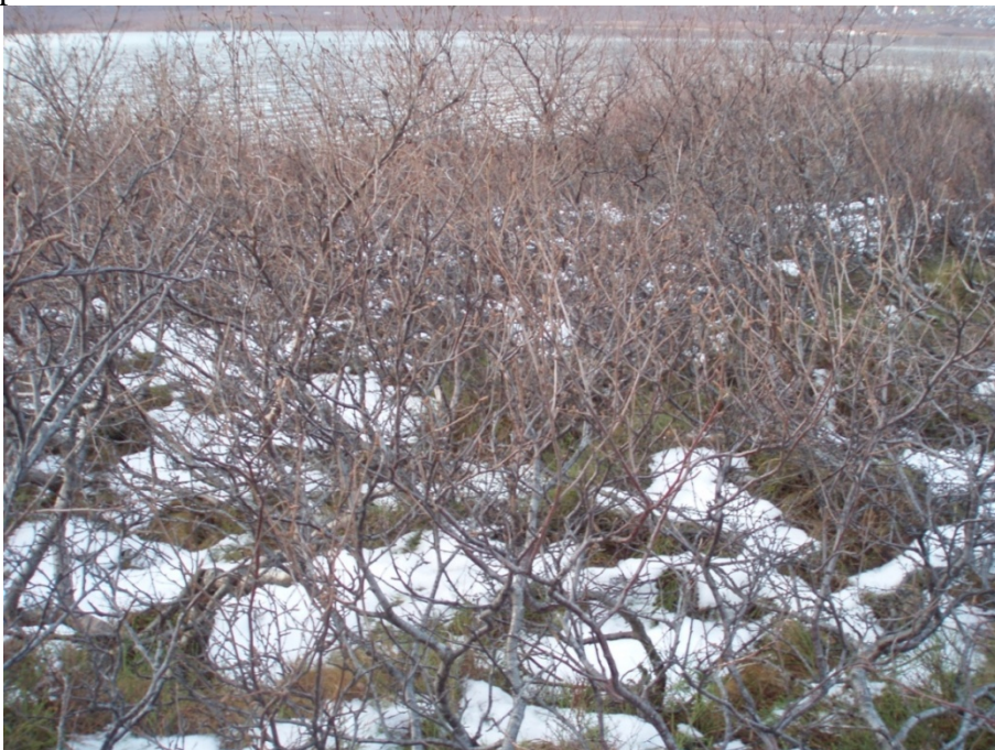
Mynd 8. Birkikjarr á rannsóknarsvæði 6.

Á rannsóknarsvæði 6 er birkikjarrið fremur hávaxið eða á bilinu 70 - 270 cm að hæð. Reiknaður lífmassi á svæðinu er frá 6.254 - 38.945 kg/ha. Meðaltal 7 mælinga er 16.984 kg/ha. Svæðið sem mun raskast er 1,1 ha að stærð og reiknaður lífmassi því 18.682 kg þurrefnis.