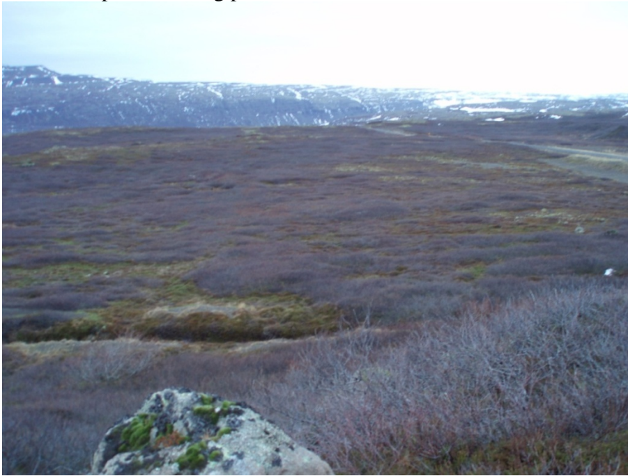
Mynd 3. Séð yfir rannsóknarsvæði 1.

Á rannsóknarsvæði 1 er aðallega frekar lágt birkikjarr og á milli mela og móa með fjalldrapa og smárunnum. Birkikjarrið sem mælt var á þessu svæði, 11 mælingar, er á bilinu 50-120 cm að hæð. Lífmassi á ha mælist frá 4.024 kg/ha og upp í 20.700 kg/ha. Að meðaltali mun skerðingin því verða 11.288 kg þurrefnis á ha. Svæðið sem vaxið er birkiskógi og kemur til með að fara undir vegagerðina er 1,8 ha. Heildarskerðing á lífmassa er því 20.319 kg þurrefnis.