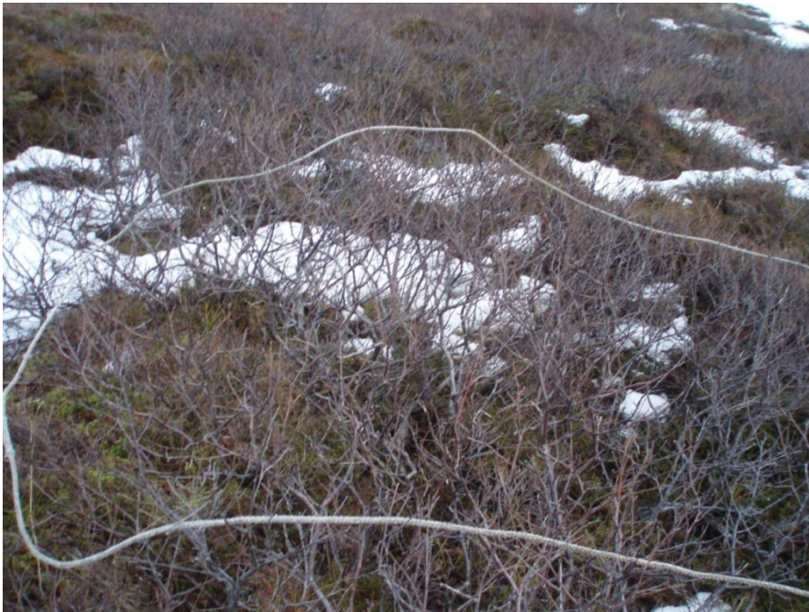
Mynd 2. Rannsóknarreitir á svæði 2, lágt birkikjarr.

Þessi aðferð er notuð við mat á lífmassa minni birkitrjáa (undir 2 m) í náttúrulegum birkiskógum við mat á kolefnisforða og bindingu á landsvísu (Arnór Snorrason, 2011, munnleg heimild).