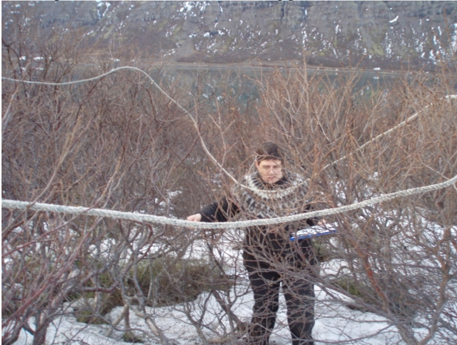
Mynd 6. Einn af rannsóknarreitum á svæði 4, birkikjarr yfir 2 m á hæð.

Rannsóknarsvæði 4 liggur meðfram núverandi vegi inn með Mjóafirði. Næst veginum er fremur hátt birkikjarr sem lækkar þegar nær dregur sjó. Kjarrið er á bilinu 70 - 200 cm að hæð. Lífmassi svæðisins reiknast á bilinu 3.654 - 30.058 kg/ha. Meðaltal 6 mælinga gefur lífmassa upp á 15.491 kg/ha. Birkivaxið svæði sem mun skerðast er 1,2 ha og er því lífmassi þess svæðis sem skerðist 18.589 kg þurrefnis.